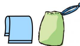
タオルは袋に入れる